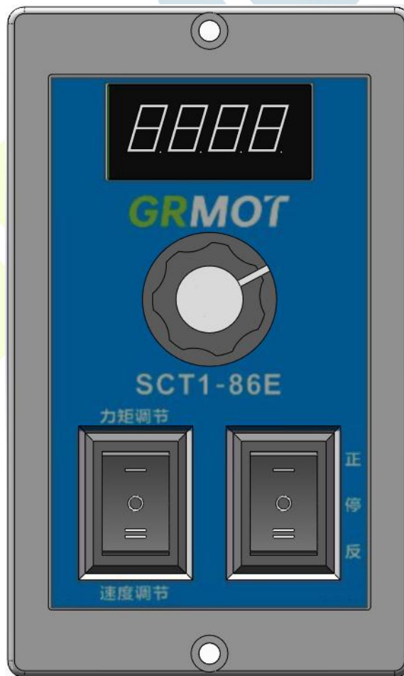
图 4.1 SCT1-86E 面板功能示意图