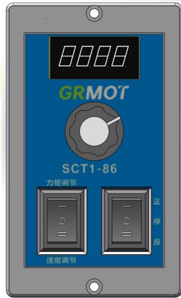
图 4.1 SCT1-86 面板功能示意图