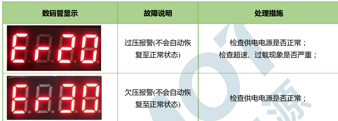
表 6.1 数码管状态指示

当驱动器出现故障时，数码管会显示 Erxx ( xx 为报警代码)，具体如下表 6.1 所示。